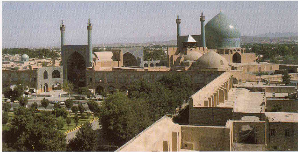
Die Königsmoschee am südlichen Ende des Meidan-i-Schah.

dem aus der Seldschukenzeit stammenden alten Basar, der sich vielfach gewunden bis zur Freitagsmoschee erstreckt.