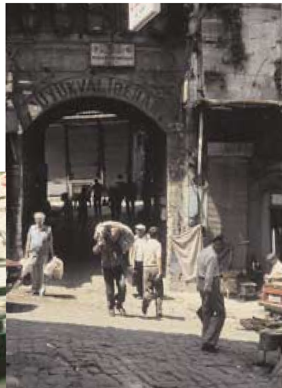
Eines der Basartore.