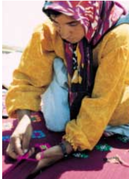
Diese junge Frau webt ein Djadjim. Interessant sind die leuchtenden Farben.

Nach gut einer Stunde bittet man uns, es uns in einem der grösseren Zelte bequem zu machen. Der