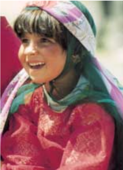
Kann man noch fröhlicher sein?

hen. Wahrlich, in der Zeit wird man zurückversetzt; läge nicht ab und zu ein Plastikkorb oder eine Pfanne aus Aluminium herum, könnte man meinen, 100 Jahre früher zu leben. Wir durften alle Zelte besuchen – trotz der festlichen Stimmung zeigten uns die Frauen, wie sie an ihren Knüpfstühlen arbeiten. Hier webt eine Nomadin an einem Djadjim mit weinroter Grundfarbe. Der alte ist zerschlagen. Wie schnell kommt sie zu einem schlechten Ruf, wenn ihr Hausrat nicht in einem guten Zustand ist!