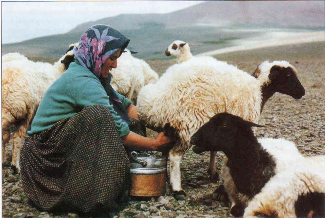
Manches Schaf muss gemolken werden, bis der Kupferkessel mit Milch gefüllt ist.

Eigentlich ist der Teppich nur ein wichtiges Nebenprodukt. Zumindest in der Lebens- und Produktionsweise der Yürüken, der Hirten und Nomaden, die seit Jahrhunderten die Hochebenen des Taurus (südl. Türkei) bewirtschaften. Im Zentrum der täglichen Arbeit steht die Butter- und Käseherstellung.