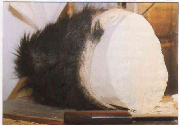
Zum Aufbewahren füllen die Yürüken Butter und Käse in Tierhäute

Der auf der Sommerweide hergestellte Käse und Butter dient den Yürüken im Winter zur Selbstversorgung; die Überproduktion verkaufen sie im Herbst auf dem Märkten. Die handbetriebene Milchzentrifuge ist eine bedeutende Neuerung im Leben der Nomaden und wirkt sich nachhaltig auf ihre Lebensweise aus.