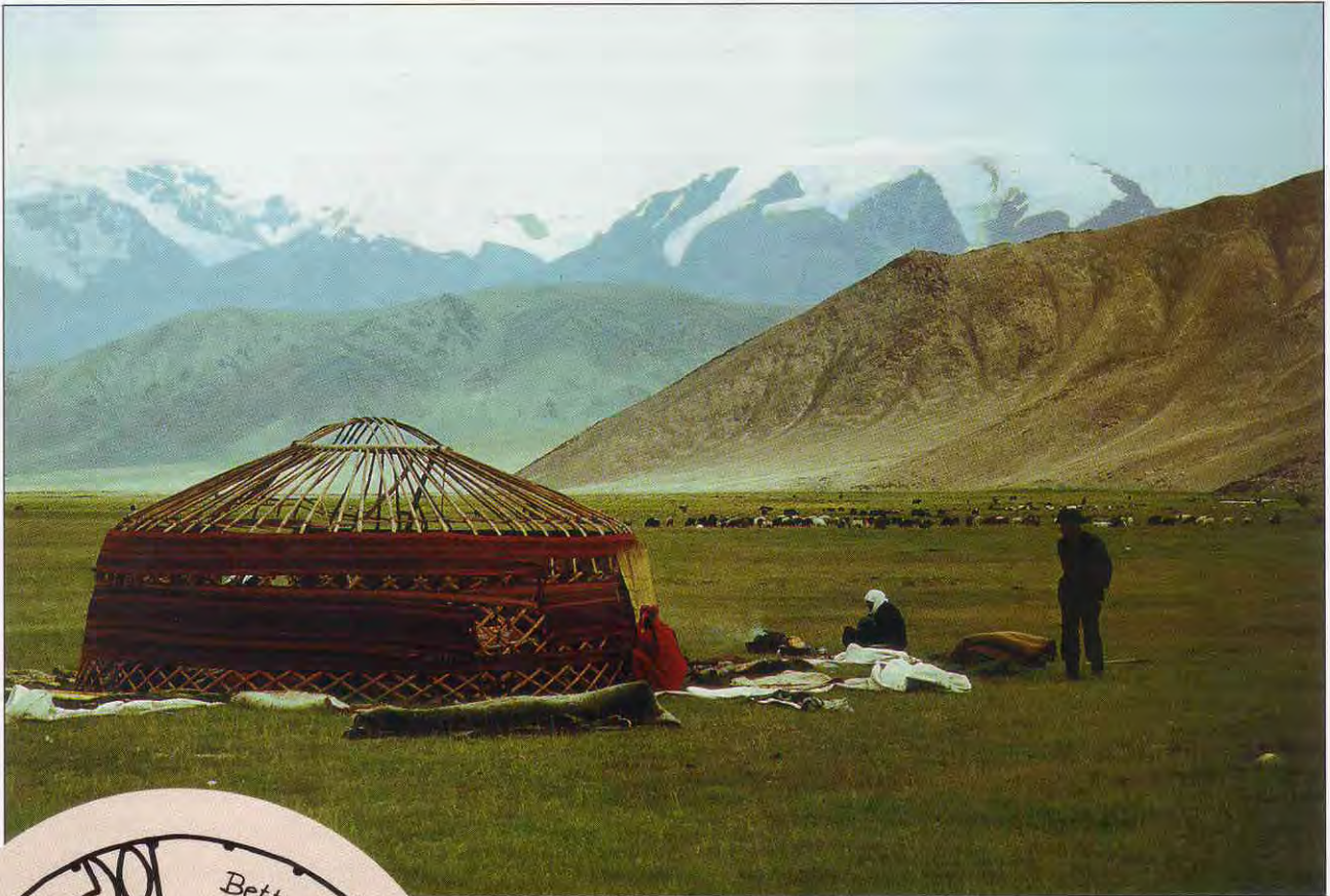
Rundhütte aus Filz der Nomaden aus Ost-Turkistan.