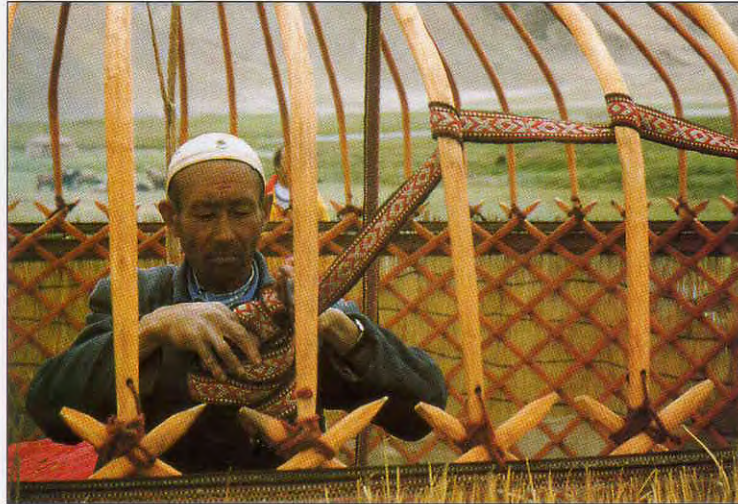
In wenigen Stunden ist die Jurte aufgebaut.

es zu einem Kreis auf, eine Öffnung für die Türe bleibt ausgespart. Darüber setzt man in einer Höhe von drei Metern ein grosses Rad, welches das Gewölbe abschliesst; drei Stützen halten es provisorisch. Sorgfältig