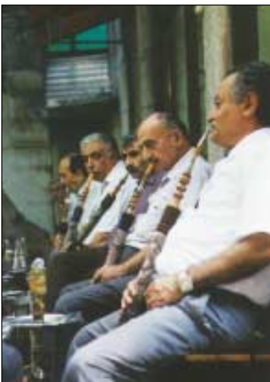
Jeder Stammgast hat seine persönliche Wasserpfeife

Wer Wasserpfeife raucht, rührt keine Zigaretten an, erklärt