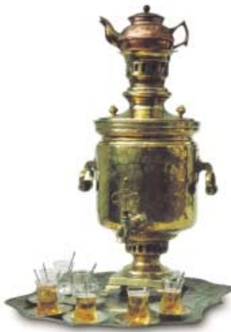
Grosser Samowar einer Tee-Schankwirtschaft. Er ist 62 cm hoch.