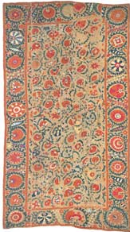
Susani aus Bochara (ca. 180 x 255 cm). Eine rare Kompositionsweise, bestehend aus aufsteigenden, sich wechselseitig nach unten einrollenden Blütenranken, über- spinnst den gesamten Grund. Farbkombinationen in den Blumen und Technik weisen auf die Oasenregion zwischen Bochara und Nurata hin.