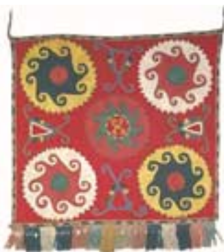
Vorhang, um während des Gebets die Spiegel zuzudecken (ca. 60 x 60 cm bzw. 40 x 60 cm).

mit natürlichen Farben und überlieferten Färbemethoden eingefärbt. Daneben findet sich in nur sparsamer Verwendung hellrotes wollenes Stickgarn. Die usbekischen Frauen arbeiten hauptsächlich mit dem Kettstich (Tambur und Ilmak genannt) für die Konturen und die grösseren Linien sowie dem Flächenstich (Basma, Kanda-Hael und Iraqui) zur Ausschmückung der Zeichnungen. Die Stickmuster haben in der Regel symbolische Bedeutung: Ranken von