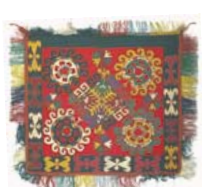
Tuch, um den Koran einzupacken (ca. 60 x 60 cm).