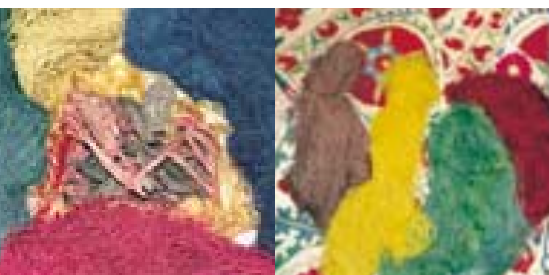
Seide und natürliche Farbstoffe, die in der Susani-Stickerei verwendet werden.

Im Ländereck zwischen dem Iran und Afghanistan im Süden, China im Osten und Russland im Norden und Westen, eingebettet zwischen dem grossen Flüssen Syr-Darja und Amu-Darja, liegen Usbekistan und Tadschikistan mit den bekannten Städten Samarkand, Buchara und Taschkent.