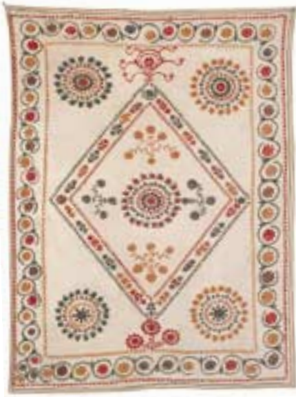
Nim-Susani aus Nurata. Zentralstern-Komposition mit liebevoll ausgestatteten Details ergeben eine bäuer- liche Arbeit der Region Bochara voll naiven Charmes.