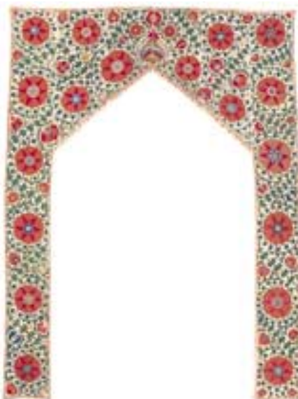
Türumrahmung aus Chodscent. Die wundervollen, reich geschnitzten Holztüren, die oft von Stickereien dieser Art eingerahmt waren, bildeten ein Schmuckstück des turkestanischen Hauses.