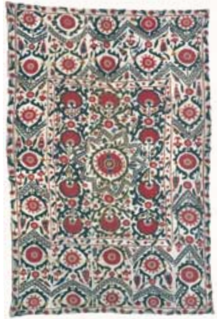
Susani aus Ura-Tube (ca. 160 x 235 cm). Im Norden von Samarkand, auf der nach Taschkent führenden Strasse, befinden sich die Oasen Chodschent und Ura-Tube.

Familie versucht die erforderliche Anzahl ohne Zuhilfenahme Fremder zu besticken, dafür mobilisiert sie alle weiblichen Mitglieder eines Klans. Eine grosse Stickerei kann eine Arbeitszeit von ein bis eineinhalb Jahre erfordern, bei dichter Bestickung auch mehr. Der Entwurf für die Anordnung der Motive und Hauptfarben liegt heute meist in den Händen eines berufsmässigen Vorzeichners, genannt Kalamkesch (Kalam = gespitzte Rohrfeder). Er wird für