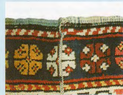
In kurzer Zeit wird diese Falte reissen.