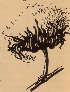
Le fruit mûr éclaté du cotonnier

Le coton se laisse bien filer de façon régulière. On peut également bien le blanchir. Pour cette raison, même dans les temps anciens, était-il utilisé pour de petits motifs d'un blanc éclatant. Pour le velours, son emploi est cependant mal approprié: la salissure est trop rapide et cette fibre s'ébouriffe très rapidement. Pour le dossier du tapis par contre, par sa régularité, sa robustesse et sa faible élasticité, le coton est idéal. Lors du lavage, son retrait régulier contribue à augmenter la rigidité du tapis. Lavé dans de la soude caustique, la résistance du coton augmente de 25%.