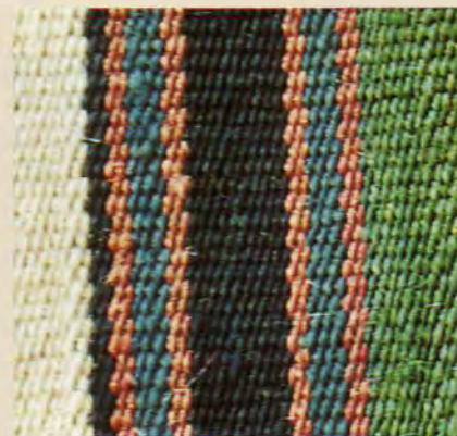
Reps de chaîne