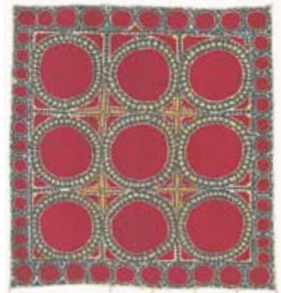
Paliak de Tachkent (env. 145 x 200 cm). Motif appelé Oi-Paliak (Oi = lune, Paliak = voûte céleste). Le fond est presque entièrement recouvert d'immenses lunes brodées en soie rouge vif séparées par des croix jaunes.

On ne pourrait qu'applaudir leurs efforts si ces broderies n'étaient pas vieillies artificiellement afin d'alimenter