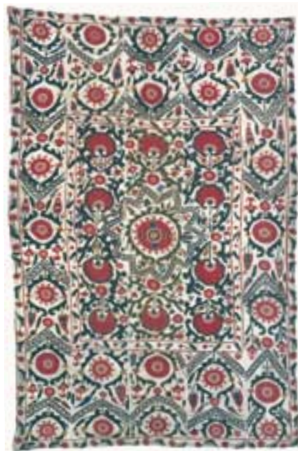
Susani de Ura-Tube (env. 160 x 235 cm). Les oasis de Ura-Tube et de Chodchent se trouvent au nord de Samarkand, sur la route qui mène à Tachkent.

d'une fiancée, parce qu'ils constituent la partie principale de la dot. Chaque famille essaie de broder la quantité nécessaire toute seule, sans aucune aide. Pour cette raison, cette activité rassemble tous les membres féminins d'un clan. Une grande broderie peut demander une année de travail, même plus si le travail est très fin. Parfois, et de nos jours