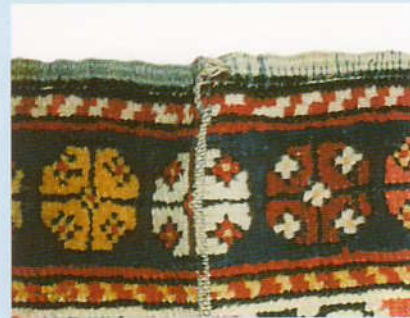
Dans peu de temps, ce Kuba se déchirera le long du pli.