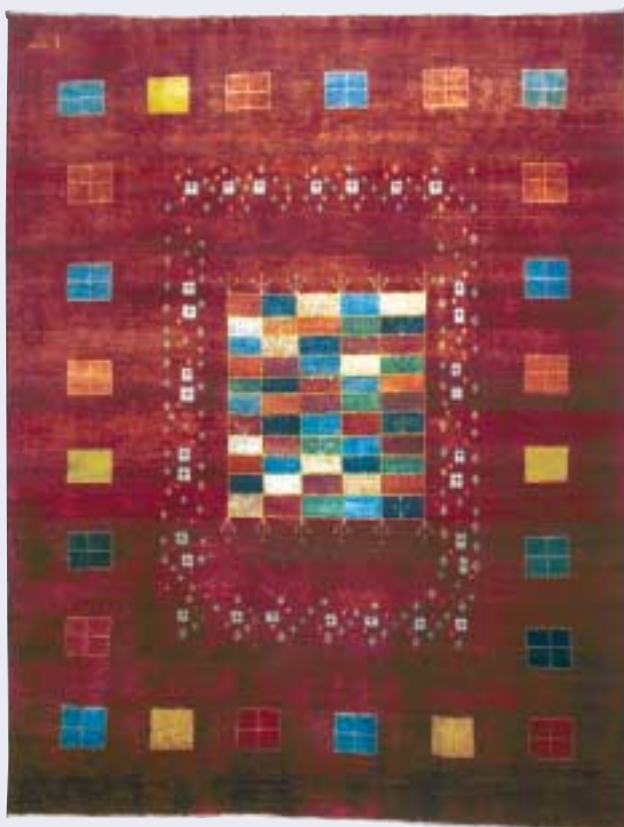
Gashgouli, 144 x 191 cm