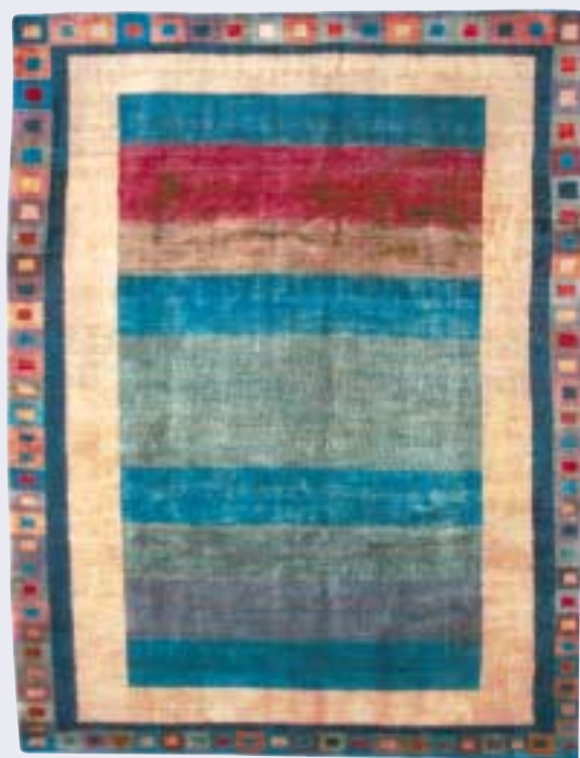
Gashgouli, 205 x 272 cm Gashgouli, 200 x 271 cm Gashgouli, 197 x 247 cm