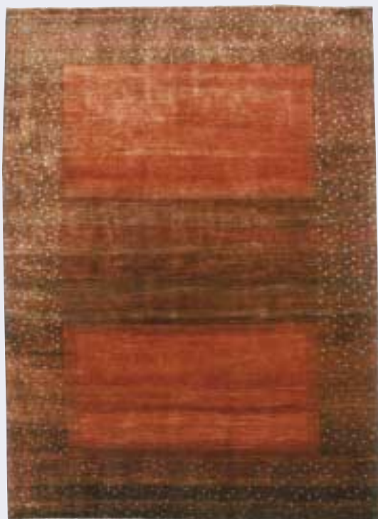
Gashgouli, 170 x 238 cm Gashgouli, 119 x 175 cm Gashgouli, 200 x 294 cm