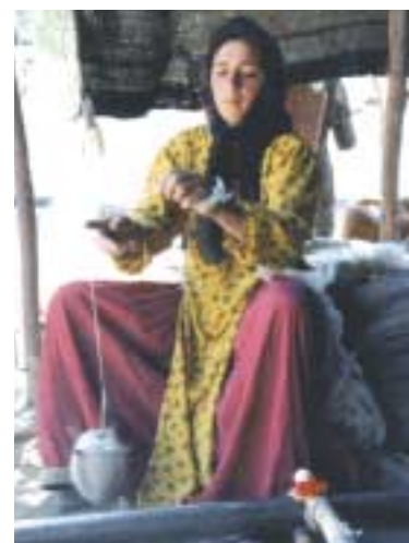
Femme nomade filant

Cela leur laisse toute latitude pour improviser. Le jeu des couleurs confère du caractère à ces tapis. Les tons de base sont des jaunes lumineux, des bleus profonds ou des rouges éclatants. On observe aussi des surfaces chinées. La noueuse prend deux brins de couleurs différentes et les noue ensemble. Par exemple, si elle mélange