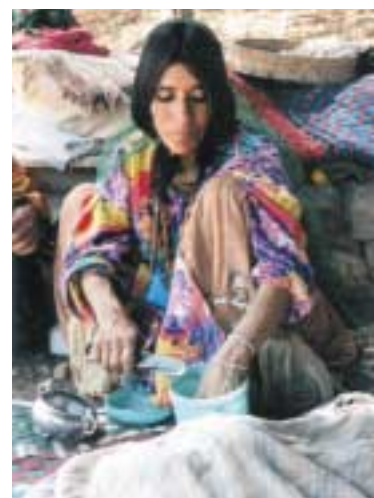
Nomade Kashgāi en train de casser du sucre

Ce tapis se trouve dans le commerce sous différentes dénominations ou orthographe: Gabeh Baseri, Kashgouli, Kash-gouli et Louribaf