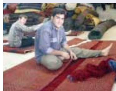
Atelier de réparation, raser, améliorer les bords