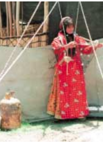
Femme nomade en train de retordre le fil

de 600 x 200 cm sous une tente et y disposent mets et boissons. Notre repas terminé, après le thé, quelques bouffées de narghilé et une promenade digestive nous pouvons enfin poser nos questions et aborder le sujet qui nous intéresse.