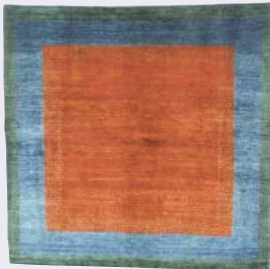
Gashgouli, 200 x 202 cm Gashgouli, 120 x 120 cm Gashgouli, 128 x 148 cm