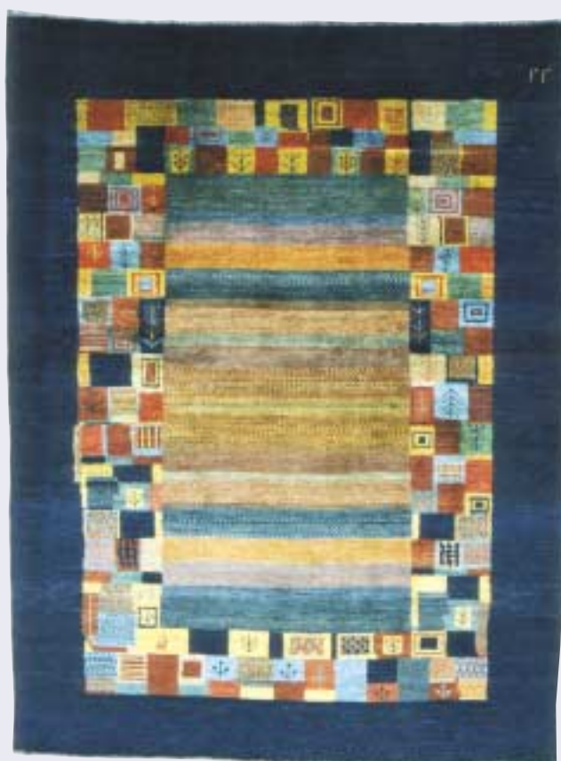
Gashgouli, 115 x 174 cm